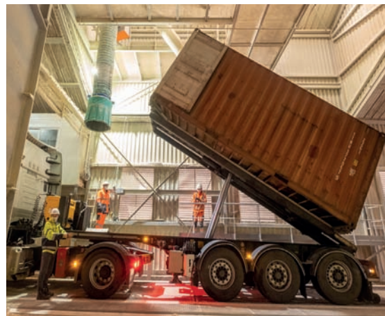
Création d'une installation de chargement mixte, de conteneurs et de bennes vrac, dédiée à Tereos sur le site de Sénalia Lillebonne.