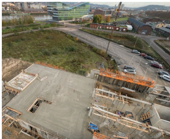
Construction du siège social de Sénalia à la Presqu'île Elie à Rouen. Fin des travaux prévue pour le 4 e trimestre 2021.

Sénalia innove pour apporter toujours plus de valeur ajoutée à la filière. Sénalia doit pouvoir développer et porter des projets collectifs, mutualisant des outils au profit de l'ensemble des organismes stockeurs.