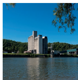
Site de Bonnières sur Seine