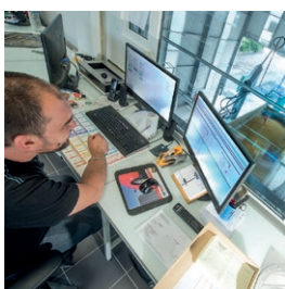
Presqu'île Elie : Nouveau poste d'agrèage