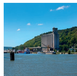
Site de Val de la Haye