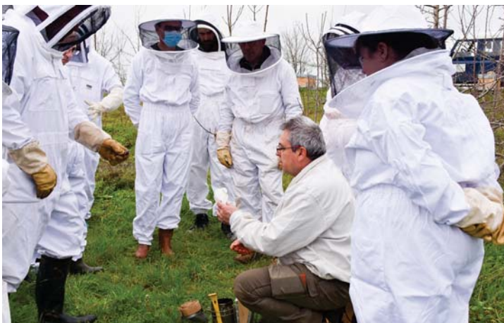
Deux ruchers-écoles ont été mis en place pour former les agri-apiculteurs.

Ne s'improvise pas apiculteur qui veut. Comme tout élevage, l'apiculture est très technique. Il faut maîtriser les étapes de développement de l'abeille et de la colonie, la multiplication des ruches... Pour former les agri-apiculteurs, deux ruchers écoles ont ainsi été créés par la coopérative Cavac, à Vix et à Pouillé. La formation a permis d'aborder le fonctionnement d'une colonie d'abeilles, la manipulation et le comportement des insectes, l'extraction du miel mais aussi la réalisation d'une colonie ou encore le repérage de la reine. L'objectif de ces ruchers écoles a également permis à chaque apprenti apiculteur de peaufiner son projet à la fois personnel et professionnel.