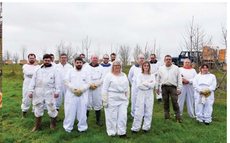
Quatorze agriculteurs-apiculteurs se lancent dans l'apiculture avec la coopérative Cavac.

Contact presse : Céline Bernardin - 06 13 37 67 75 - c.bernardin@cavac.fr